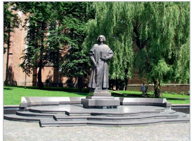
Рис. 4. Пам'ятник Юрію Котермаку у Дрогобичі

Помер Юрій Дрогобич (Котермак) 4 лютого 1494 року. Вченого з почестями поховали у м. Кракові, хоча точне місце захоронення невідоме.