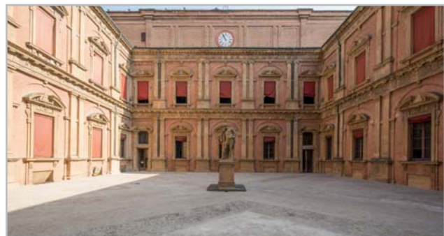
Рис. 2. Найдавніший університет Європи — Болонський [4]

Здавалося б, на цьому можна й зупинитися, але це не про Юрія — для продовження навчання пішки йде до Болонії (місто в Італії), де в епоху Відродження розташовувався один із центрів наукової думки — Болонський університет (рис. 2). Юрія цікавила медицина, але згідно зі статутом університету спочатку студент мав оволодіти знаннями з математики, філософії, вдосконалити латину й знання з риторики та грецької поезії. Оце так! Юрій Котермак слухав лекції самого Габріеле Зербі, одного з зачинателів герокомії — гігієни старечого віку. А ще цей професор викладав логіку та теоретичну медицину, тобто сучасні основи патології та анатомію.